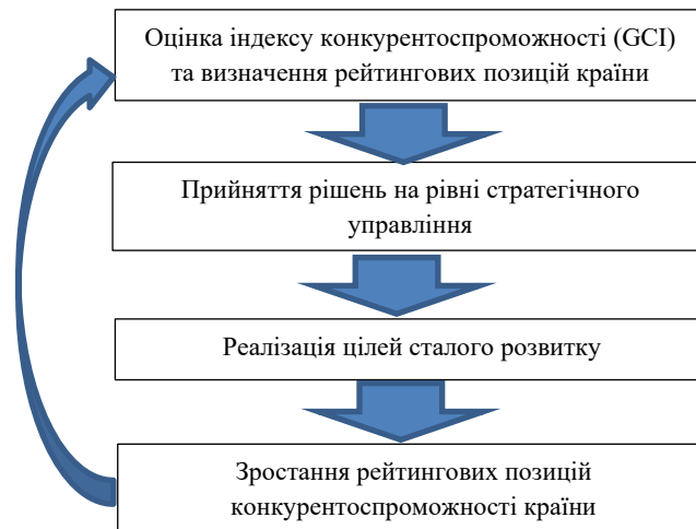
Рисунок 3 – Складові елементи в системі використання індексу росту конкурентоспроможності (GCI)

- як правило, складовими кожного індексу на основі міжнародних порівнянь є набори різних економічних показників, одиниць вимірювання та методології розрахунку показників. Певні набори показників можна отримати з національної статистичної звітності досліджуваних країн на основі даних відкритого доступу. Це, безумовно, негативно впливає на результати узагальненої оцінки, оскільки збільшується ступінь її невизначеності, оскільки в різних країнах використовуються різні статистичні показники.